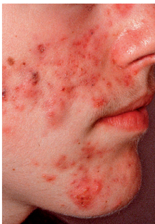
Acne conglobata im Gesicht