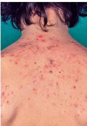
Acne conglobata am Rücken