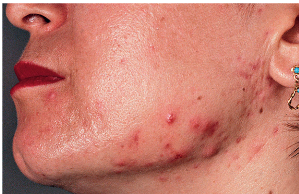
Spätakne bei einer erwachsenen Frau

Vor allem bei Frauen sieht man oft, dass eine Akne auch über das junge Erwachsenenalter hinaus bestehen bleiben kann. Diese Akne ist oft schwierig zu behandeln und gehört darum stets in eine hautärzt-