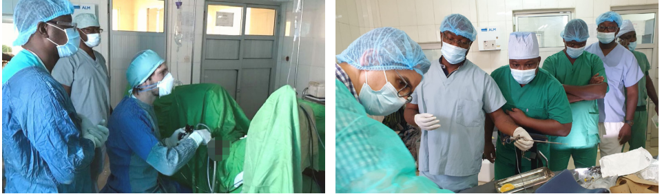
Abb.: Togolesische Ärzte werden in minimal-invasiven Techniken geschult

Ziel ist die Schulung des medizinischen Fachpersonal in modernen schonenden urologischen Eingriffen, um die Sterblichkeit und die Gesundheit der Patient*innen in Togo nachhaltig zu verbessern.