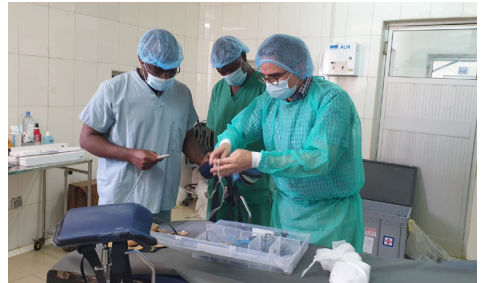
Abb.: Eindrücke vom Spital in Kara

Urologische Behandlungsmethoden in Togo sind sehr veraltet, risikoreich und häufig mit langen Spitalaufenthalten und zu hoher Sterblichkeit bei den Patientinnen und Patienten verbunden. Die Klinik für Urologie versucht durch eine gezielte Schulung des Personals vor Ort und durch die Spende von medizinischem Equipment einfache und effektive minimal-invasive Methoden in Togo einzuführen, welche die Patientinnen und Patienten weniger belasten und die Sterblichkeit nachhaltig reduzieren.