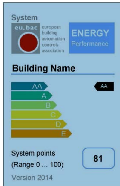
Abbildung 1: eu.bac Zertifizierung