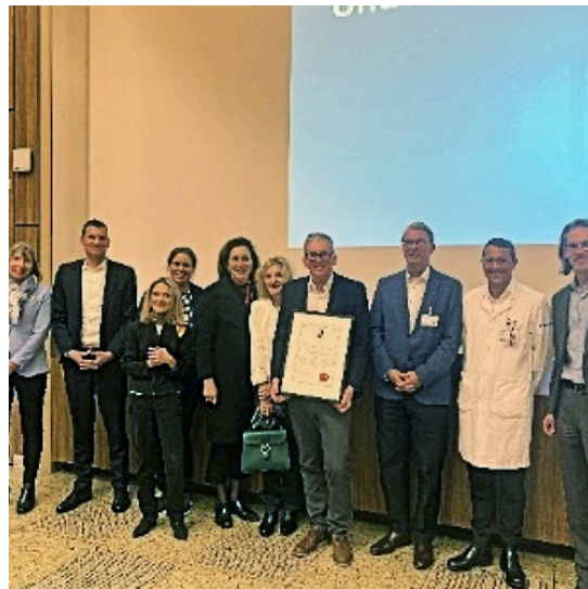
Stiftungsrat und Administrative Leitung der Bruno Bloch Stiftung